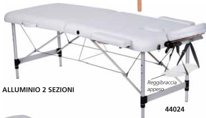
ALLUMINIO 2 SEZIONI