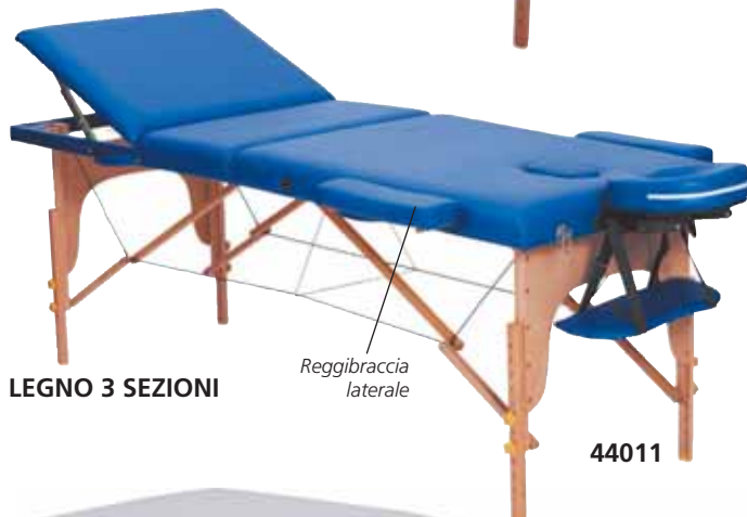
LEGGNO 3 SEZIONI