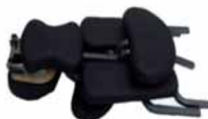
Sedia da massaggio piegata