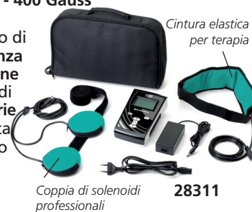
Coppia di solenoidi professionali 28311 Cintura elastica per terapia