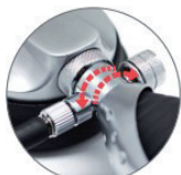
Uso con mano sinistra e destra