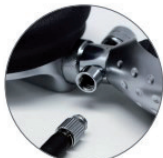
Connettore maschio e femmina